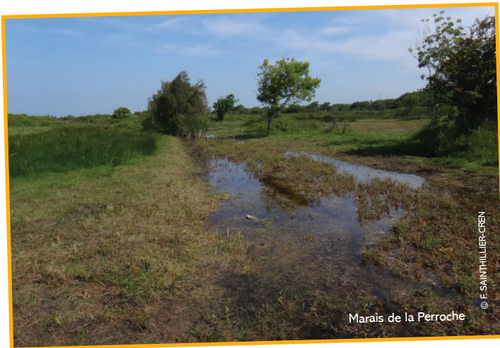
Marais de la Perroche