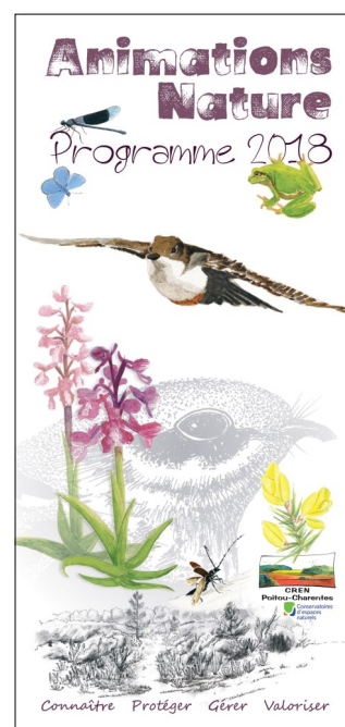
Couverture du programme 2018

Le programme est aussi à consulter et à télécharger sur le site Internet du Conservatoire ( cren-poitou-charentes.org ). Pour tout renseignement complémentaire, merci de contacter le CREN au 05 49 50 42 59.