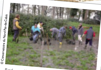
Restoration de mare et mise en clôture de la RNR de Lostebarne et Woohay