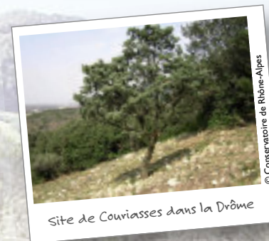
Site de Couriasses dans la Drôme

Grâce aux chantiers d'insertion, l'association Tremplin permet chaque année à quelques dizaines de personnes de reprendre contact avec le monde du travail tout en entretenant les espaces naturels.