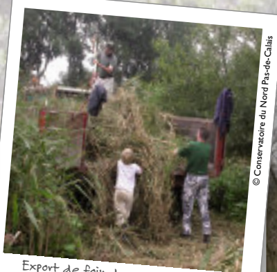
Export de foin dans une roselière de la prairie de l'Escaut