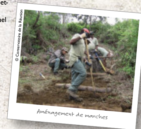
Aménagement de marches

tent l'accompagnement individuel des personnes dans la préparation d'un projet professionnel lié à la préservation de la nature.