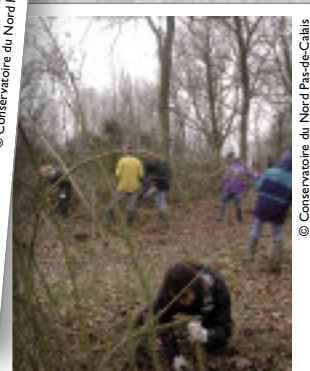
Chantier communal de Sorrus