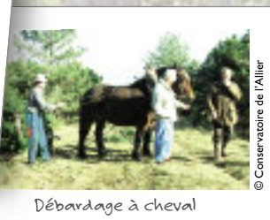
Débardage à cheval