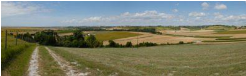
Rives de Gironde Paysage

Plus proche de l'estuaire, les combes alternent avec les falaises mortes, jadis soumises aux marées. Ses balcons crayeux découpent le trait de côte avec force tandis qu'un complexe réseau de sentiers, canaux et chenaux organise les terres basses, aux ambiances contrastées mêlant vocable portuaire, pastoral, cynégétique, agricole et naturel.