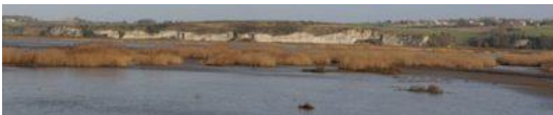
Ancien polder Mortagne

Depuis les terres hautes, aux abords d'un vallon cultivé rejoignant le marais desséché (à gauche)