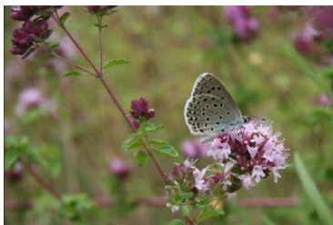
Azuré du serpolet

Les inventaires faunistiques ont mis en évidence une entomofaune remarquable : 5 espèces de papillons rares et menacés en Poitou-Charentes dont une protégée au plan national (l' Azuré du Serpolet ) et 2 criquets rares en Poitou-Charentes ( Criquet des jachères et le Méconème fragile ). Par ailleurs, la lisière forestière est une zone de chasse potentielle des chiroptères ayant leurs gîtes d'hivernage et de reproduction sur le Val d'Anglin (15 espèces inscrites sur les annexes 2 et 4 de la Directive Habitats-Faune-Flore).