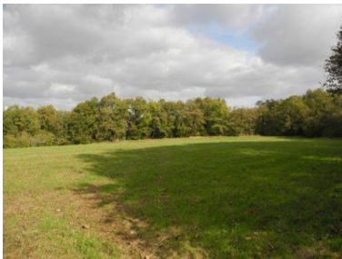
Pelouses d'Angles-sur-Anglin

Cette prairie joue un rôle de transition paysagère entre les boisements du domaine des Certaux et le bourg d'Angles-sur-l'Anglin. À proximité des habitations, elle témoigne des pratiques agricoles passées et constitue un écrin de qualité pour les ruines du château surplombant la vallée de l'Anglin, situées non loin. La parcelle est entourée d'un chemin forestier bordé de part et d'autre de murets. Il permet de descendre dans le fond de vallée et de rejoindre le bourg.