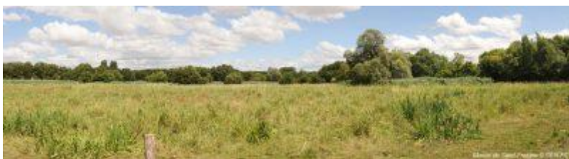
Marais de Saint-Fraigne (Charente)