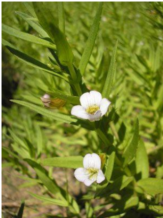
Gratiola officinale

Le marais de Saint-Fraigne constitue un ensemble de terrains marécageux inondés par les débordements de l'Aume. Ce marais repose sur un substratum calcaire du Jurassique moyen sur lequel se sont déposés successivement des graviers calcaires et une matrice argileuse, des argiles gris-vertes très compactées sur 0,80 m d'épaisseur, de la tourbe noire puis marron sur 2,60 à 4,20m d'épaisseur et de la terre végétale.