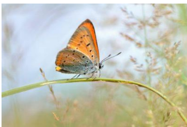
Cuivré des marais

Le marais de Saint-Fraigne héberge un riche patrimoine faunistique sauvage. Le groupe le mieux représenté est celui des oiseaux avec 89 espèces, pour un grand nombre nicheuses. Les roselières accueillent entre autre le Phragmite des joncs , la Rousserolle effarvate et le Bruant des roseaux .