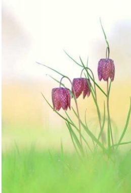
Fritillaire pintade