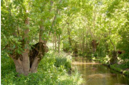
Saint-Georges de Rex et d'Amuré

Bien que le marais ait été créé de toutes pièces par l'homme et qu'il soit d'une grande artificialité, il s'en dégage un air à la fois de grande familiarité, voire presque d'intimité. Du fait d'une assez grande hétérogénéité d'occupation des sols –boisements, friches, mégaphorbiaies, prairies, etc.- et de la quasi absence de bâti, le lieu revêt une dimension naturelle et sauvage. L'endroit est recherché par le touriste en quête de calme et d'authenticité, pour son caractère paisible et verdoyant.