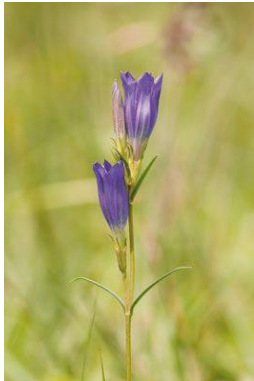
Gentiane pneumonanthe