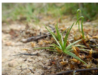
Isoete épineux

* habitats prioritaires au sens de la directive Habitats-Faune-Flore.