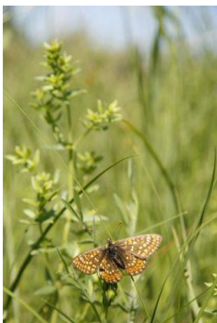
Damier succise

Les inventaires font également état d'un minimum de 340 espèces de plantes dont 5 bénéficiant d'une protection légale (3 de protection nationale et 2 régionale) et 24 autres inscrites sur la liste rouge régionale ou déterminante pour la désignation des ZNIEFF. La rivière Gartempe est un axe majeur de remontée du Saumon atlantique , de la Lamproie marine (classement en Axe Grands Migrateurs). Certains de ses petits affluents abritent des populations relictuelles d' Écrevisses à pieds blancs . Parmi les autres espèces animales, on peut noter la présence de la Loutre d'Europe , du Castor d'Eurasie , du Cincle plongeur (unique site de reproduction du département de la Vienne) et celle du Gomphe de Graslin , de l' Agrion de Mercure et de la Cordulie à corps fin . Les inventaires réalisés font état de 10 espèces de chiroptères présentes dont 5 d'intérêt communautaire. Les boisements et les linéaires arborés sont exploités par le Lucane cerf-volant , les prairies fleuries de fonds de vallon abritent de petites populations de Cuivré des marais , de Damier de la succise .