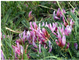
Astragale de Montpellier

L'intérêt du site repose en partie sur la présence d'habitats de pelouses sèches calcicoles. Les conditions particulières de ces coteaux (pentes fortes, substrat calcaire, exposition sud et faible pluviométrie) permettent l'installation d'espèces à tendance méridionale. Menacées par l'abandon des pratiques agricoles, ces pelouses se boisent petit à petit.