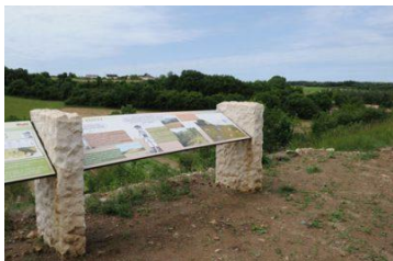
Sentier d'interprétation, Availles-Thouarsais

Afin de faire connaître ce patrimoine remarquable et la nécessité de le préserver, des animations grand public sont régulièrement organisées et un sentier d'interprétation a été réalisé en 2015.