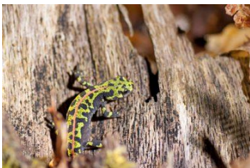
Triton marbré

Le site présente un patrimoine faunistique relativement riche avec 12 espèces de chauves-souris présentes dont certaines utilisent la grotte en période d'hibernation uniquement. La présence des nombreuses mares permet également d'avoir des effectifs importants d'amphibiens, avec notamment le Triton marbré ( Triturus marmoratus ) ou la Rainette verte ( Hyla arborea ). Au niveau floristique, on peut noter la présence de 10 espèces patrimoniales dont l' Odontite de Jaubert ( Odontites jaubertianus sbsp. jaubertianus ).