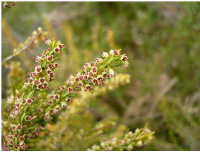
Bruyère balai