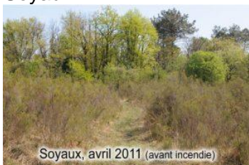
Soyaux, avril 2011 (avant incendie)

Série issue de l'observatoire photographique du paysage n°4 du site des Brandes de Soyaux :