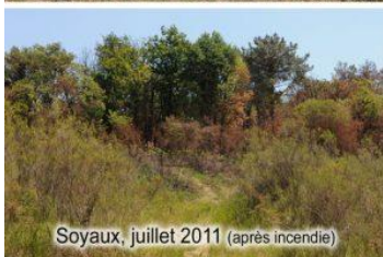
Soyaux, juillet 2011 (après incendie)