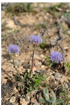
Globulaire de Valence

Constitués par des calcaires durs du Turonien supérieur, les plateaux du Vignac et des Meulières présentent une topographie remarquablement plane, dont le point culminant est à 108 m d'altitude. Localement, on peut rencontrer des placages argileux résiduels. Au fond du vallon, des sols alluviaux calcaires, limono-argileux présentent, çà et là, des niveaux paratourbeux. Des mini falaises et des éboulis rocheux sont par ailleurs présents en rupture de pente.