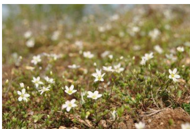
Sabline des chaumes

Le fond de vallée est parcouru par un ruisseau issu d'une source qui, avant d'être canalisé pour des besoins agricoles, suivait un parcours sinueux à travers la zone humide. Une mare permanente accueille notamment le Sonneur à ventre jaune ( Bombina variegata ), un petit crapaud.