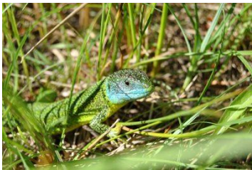
Lézard vert