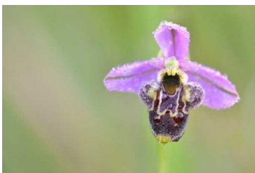
Ophrys bécasse

Abritant des plantes à affinité méridionale, les pelouses sèches de la Côte-Belet sont réputées pour leurs orchidées : 23 espèces aux couleurs et formes étonnantes ont été recensées.