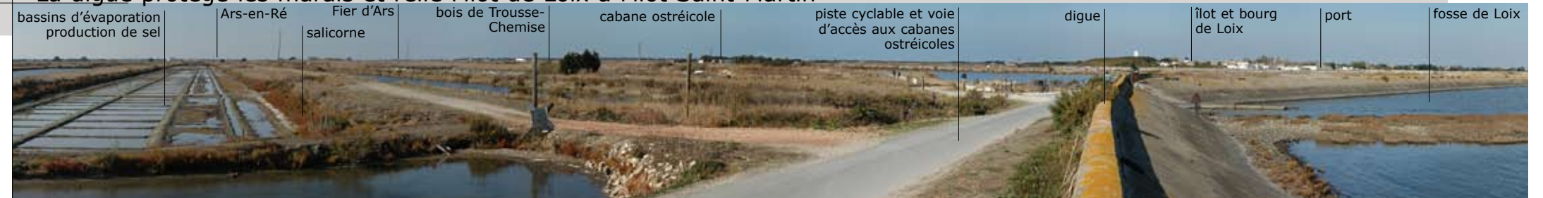
La digue protège les marais et relie l'îlot de Loix à l'îlot Saint-Martin

Ré ne culmine qu'à 18m au-dessus du niveau de la mer. Elle est formée de trois îlots reliés artificiellement par l'homme. À l'est, rattaché au continent par le pont, l'îlot St-Martin est la partie de l'île la plus large et la plus fertile, essentiellement consacrée aux vignes, aux cultures maraichères et aux boisements de pins. À l'ouest, l'îlot d'Ars, simplement relié à celui de St-Martin par l'isthme du Martray aurait depuis longtemps disparu sans les digues qui assurent sa protection. Les marais salants y font encore l'objet d'exploitation traditionnelle et sont concomitants avec les parcs à huîtres. Ils sont le paradis de milliers d'oiseaux migrateurs. Enfin entre les deux, l'îlot de Loye (Loix) rattaché à celui de St-Martin par une petite route serpentant entre les salines, est la partie la plus tranquille et la plus isolée de l'île.